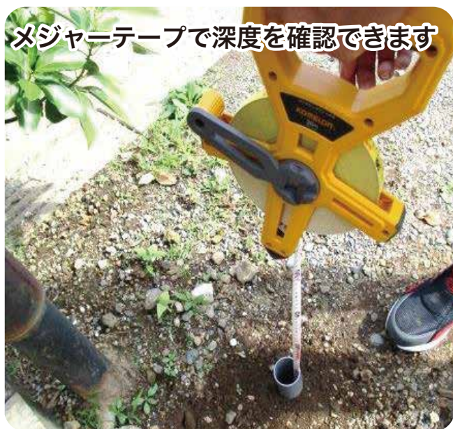
メジャーテープで深度を確認できます